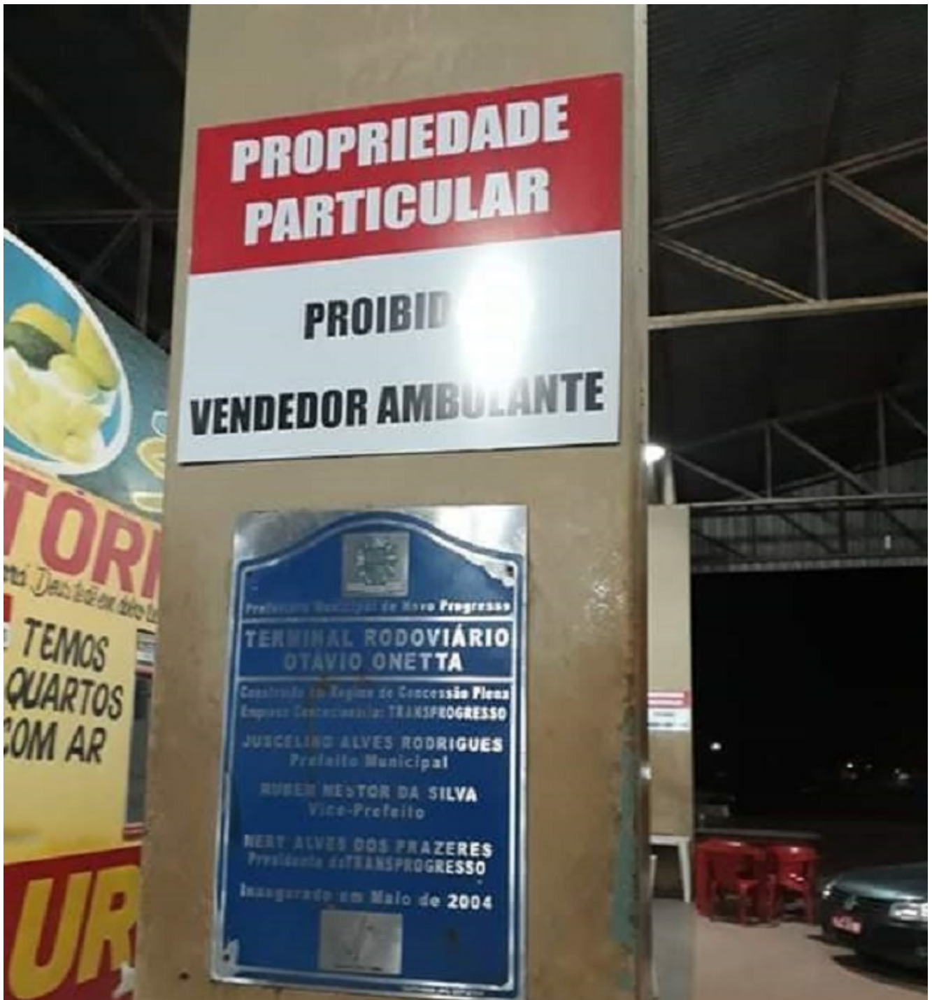
Placa fixada no terminal de Propriedade Particular.

A mulher de um ambulante , Érica A. Albuquerque, de 42 anos, postou que a atividade dos ambulantes é um caminho para a atual crise brasileira. “É normal ver o comércio ambulante em todo o País. É uma alternativa para se sustentar em meio a crise que nossa cidade passa”, afirmou Érica.