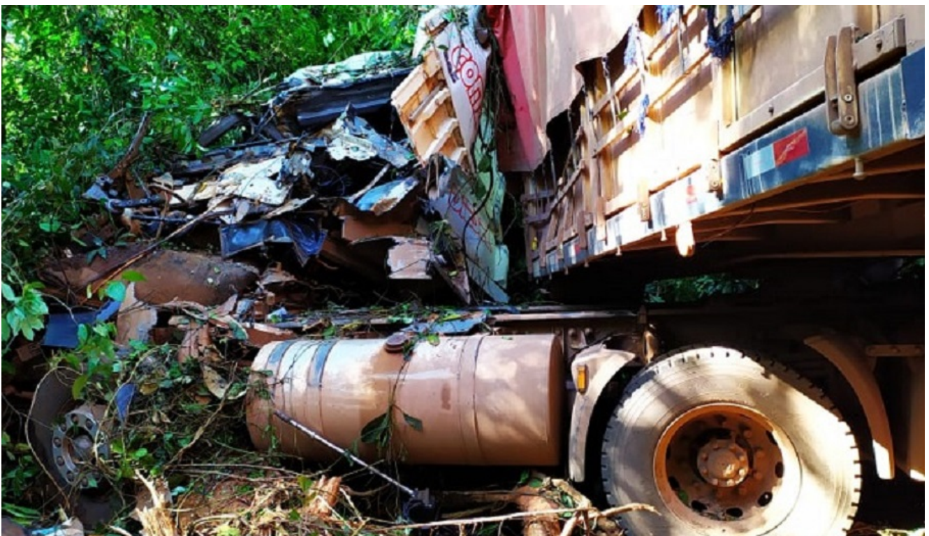
Carreta saiu da pista na BR-163