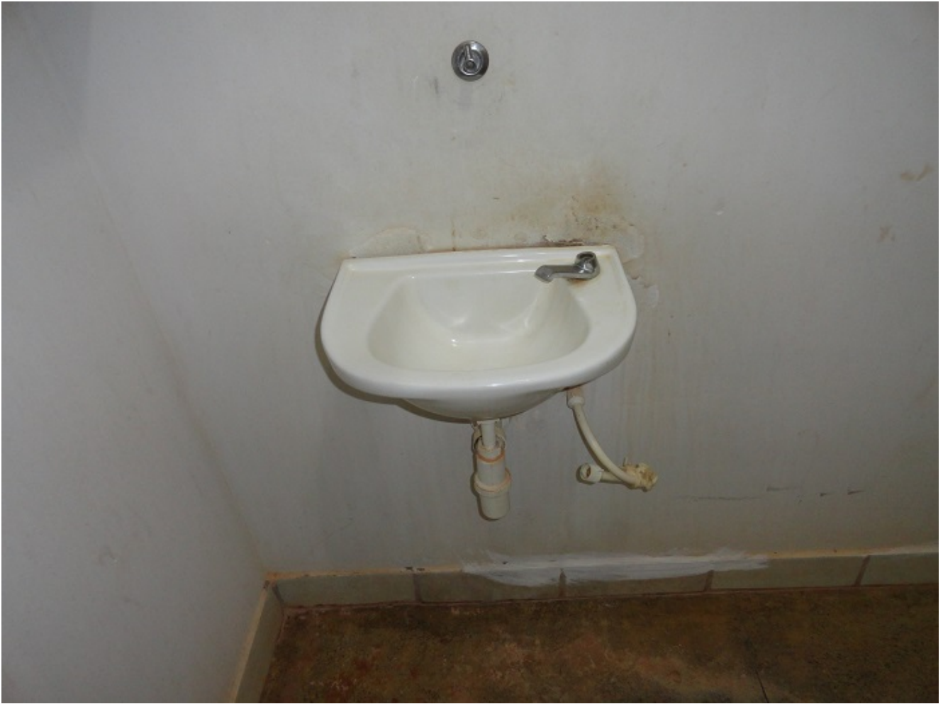
Pia da banheiro que não tem água.