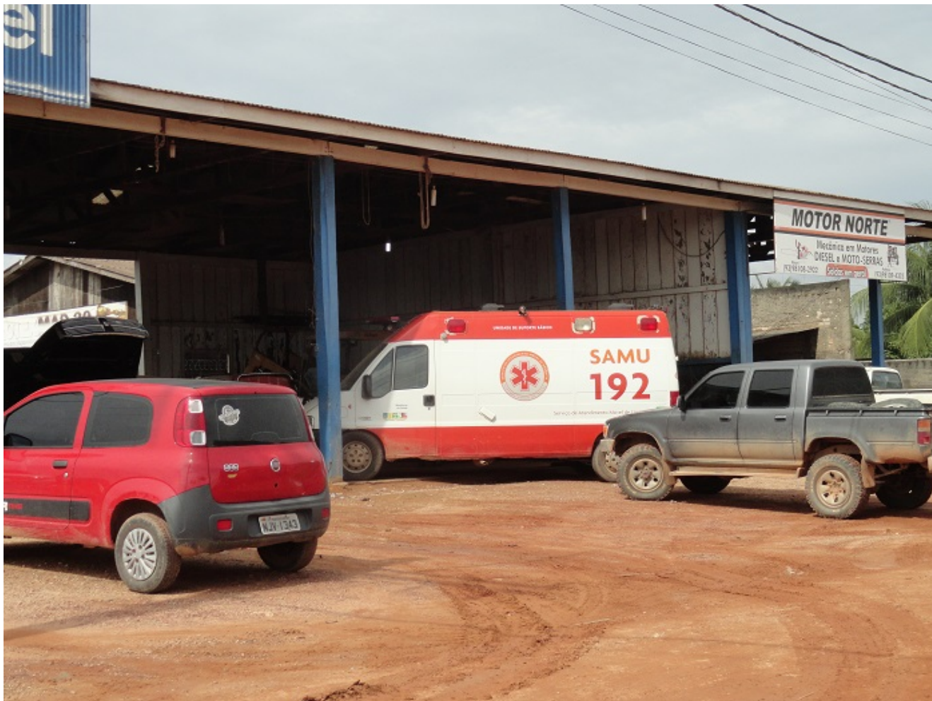
Ambulância do SAMU na Oficina

Entramos em contato com a oficina a qual nos informou que o problema é na injeção eletrônica e estão fazendo o orçamento para passar a secretaria de saúde, mais que provavelmente farão o serviço se o pagamento for a vista.