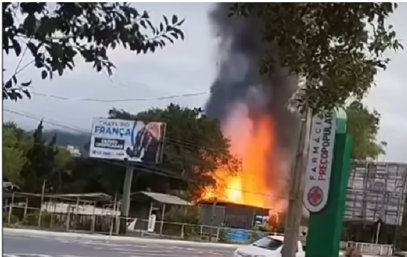
Casa incendiada em SC

chegou a realizar pesquisas no Google para planejar o atentado. Ela contou ainda que, ao receber os registros das pesquisas feitas pelo ex-marido, o questionou: “Você vai mesmo fazer essa loucura?”.